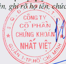
THAI HOANG LONG

Người được ủy quyền công bố thông tin (Ký tên, ghi rõ họ tên, chức vụ, đóng dấu)